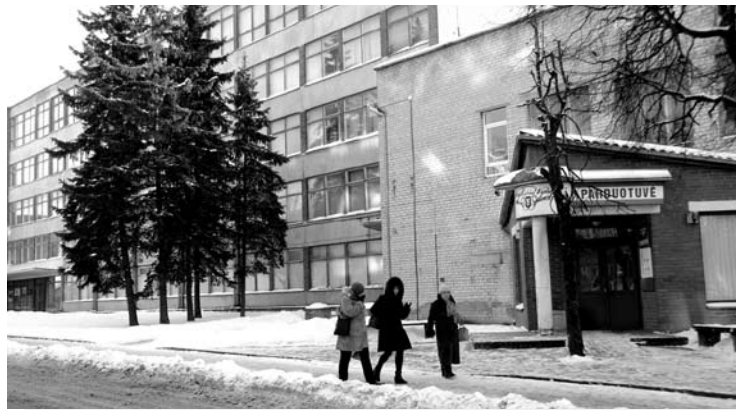
Keičiantis „Anykščių vyno“ pavaldumui, jo savininkai išliks tie patys.

Kol kas nėra duomenų apie galimus pasikeitimus „Anykščių vyne“. Realiausia, kad įmonės valdymo pakeitimas gamyklai didesnės reikšmės neturės. Šiuo metu AB „Anykščių vynas“ veikia kaip