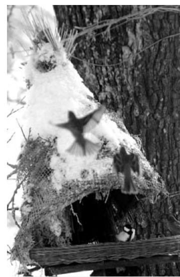
Apie lesyklę sukasi žylės ir žvirbliai.