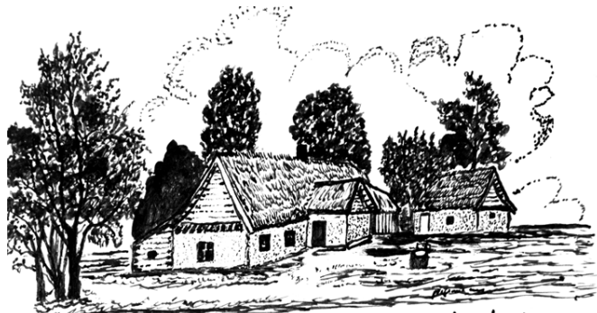
V Žviko. g Namas. Pasusienio kaimas. 1950 m.