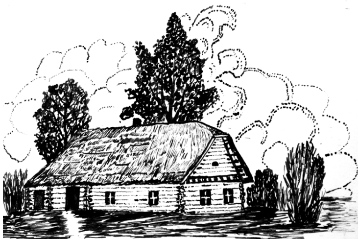
Kriaučiuno g namas. Pasusienio kaimas - 1953 m.